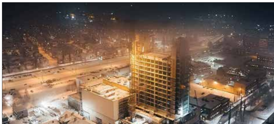
Sara kulturhus, centrala Skellefteå.

Det sägs att Sverige är det enda landet där folk lugnt står kvar i kö om brandlarmet startar i affären. Här är vi trygga och förutsätter att brandlarmet satts igång av butiksbakade bröd som blivit välgräddade. Detsamma gäller krigslarmet. Vi är trygga och vet att signalen betyder att det är ett nytt kvartal. Det mest överraskande är att klockan redan är tre på måndag eftermiddag.