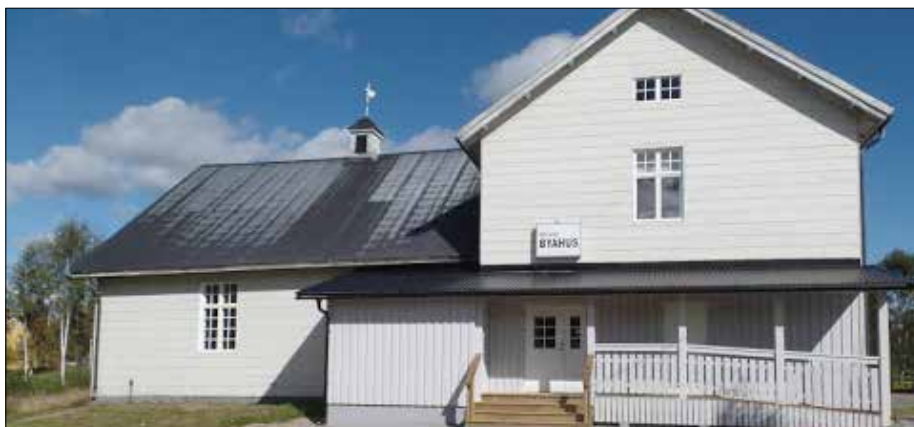
Hörnsjö byahus står stadigt och inväntar 100-års jubileum.

Vi gav bort bönhuset till Intresseföreningen, så numera hyr vi de lokaler som vi tidigare ägt. Vi hade i mellandagarna 2012 ett kombinerat avsluts- och nystartsmöte. Sedan dess har oljeeldningen bytts ut till bergvärme och en stor del av nedre våningen är renoverad. Koret längst fram i Byahuset ser ut som förr. Det finns portar och ett draperi i vackert ljusgrönt att dra