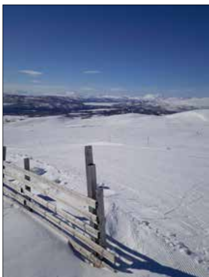
Vy från Kungsliften, Hemavan.

Vi får fortsätta drömma om läger och fjällen och ta oss ut i vinternaturen där vi bor.