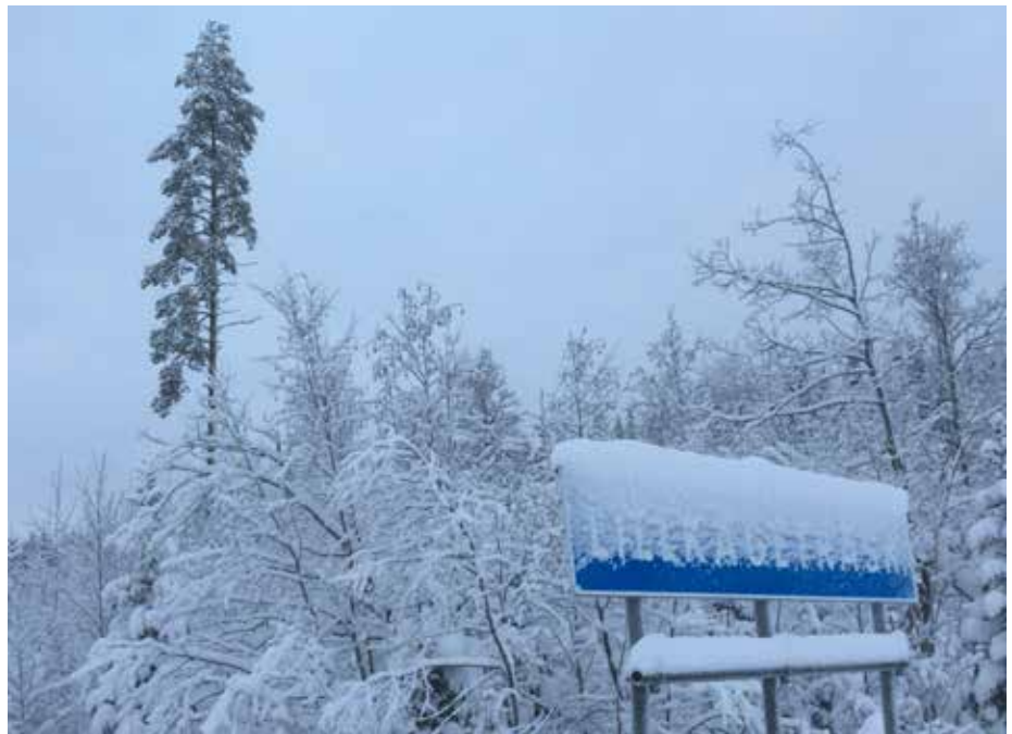
Fridfullt vinterlandskap.

Hos en av grannarna har snön sakta börjat glida ned från taket och bildar en tung, vit markis över fönstren på övervåningen. Tänk att snön håller för att hänga fritt flera decimeter över takkanten!