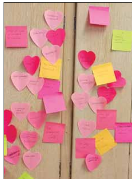
Vad är bra och vad är mindre bra på min arbetsplats? EFS Västerbottens anställda fokuserade på arbetsmiljöfrågor under en personaldag i maj.

FÖR ATT GE PERSONALEN goda förutsättningar för att utföra sitt jobb bör både EFS Västerbotten som arbetsgivare och de lokala föreningarna hjälpas åt att ta det ansvar det åligger dem på respek-