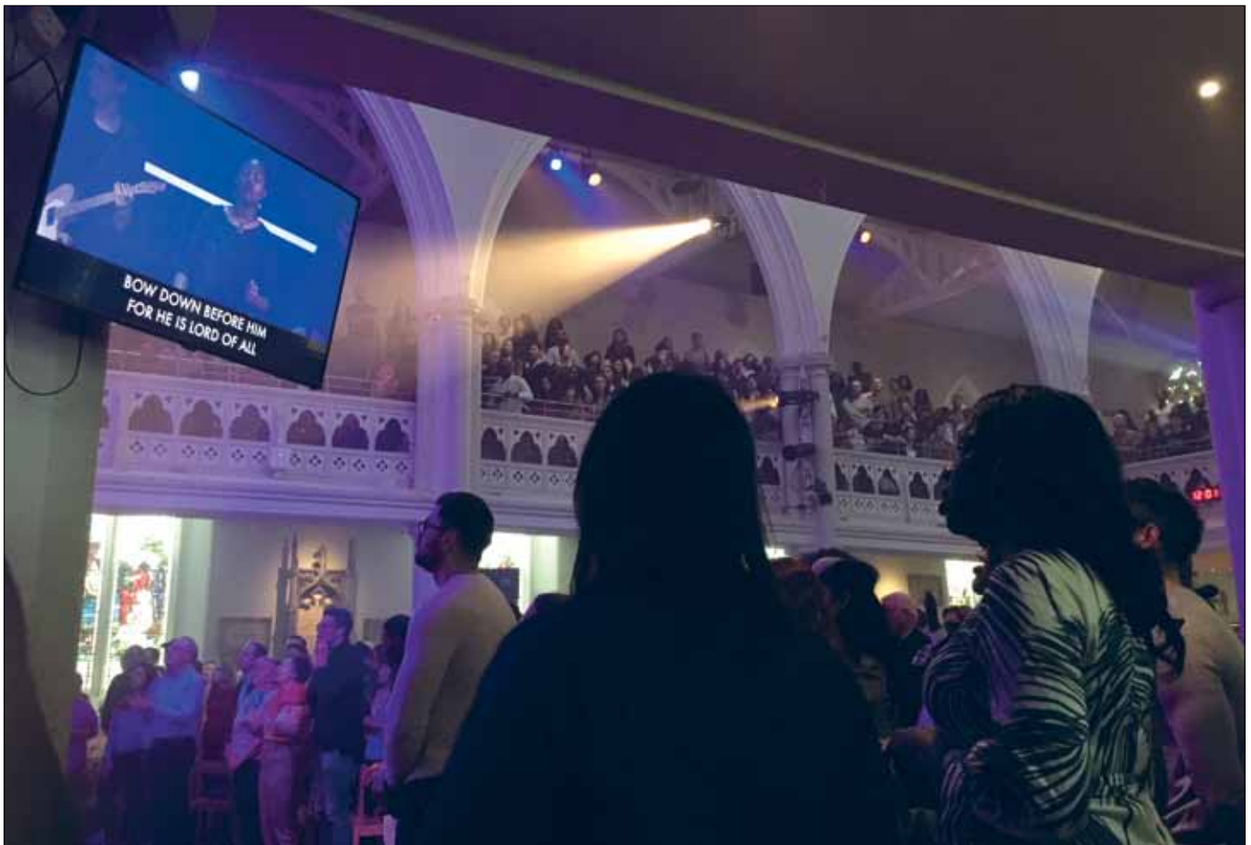
Resenärerna till London deltog i många gudstjänster, här i kyrkan Holy Trinity Bromton.