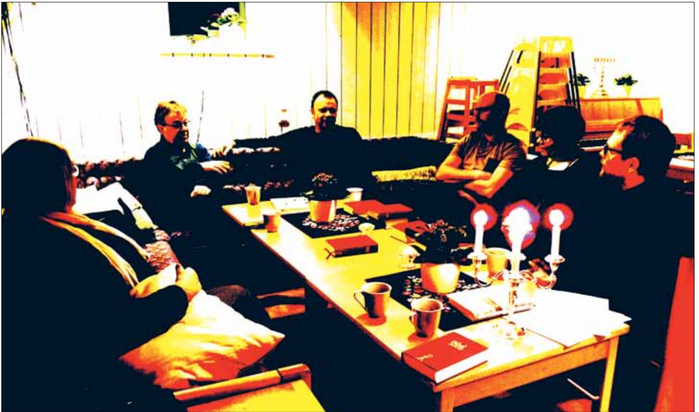
Att läsa Bibeln och samtala med andra kan vara en spännande väg att få bibelordet att landa och få fäste i ens eget liv.