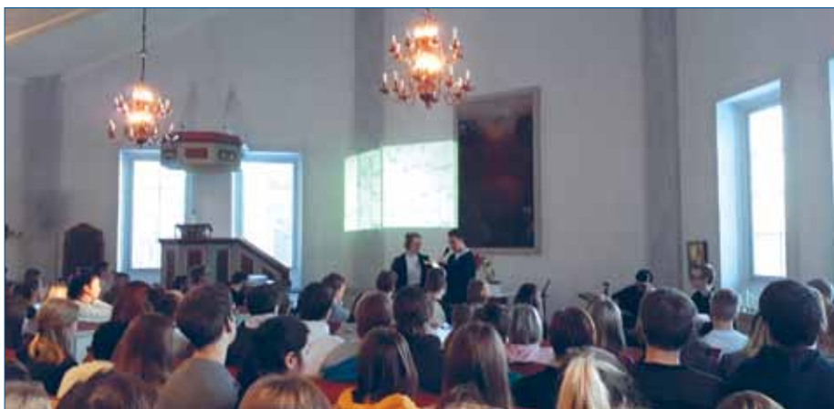
Drygt hundra ungdomar fyllde Strömbäcks kyrka vid de gemensamma samlingsarna under Livskraft Norr 2018.