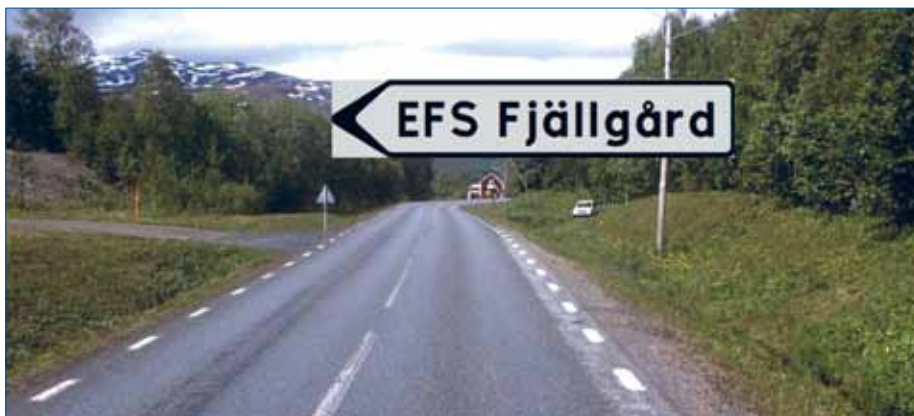
Skyltningen till EFS fjällgård i Klippen har varit undermålig, men nu ska det bli ändring. En skylt är på väg att sättas upp, så nu blir det bli lättare att hitta. Bilden är ett montage, men när skylten väl är på plats kommer den att finnas ungefär vid stolpen som syns till höger.