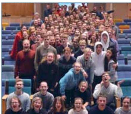
Många ungdomar valde att fira in nyåret på lägret Livskraft Norr.

LIVSKRAFT NORR är ett nyårsläger för ungdomar som varje år går av stapeln den 28/12-1/1, och där man tillsammans med varandra och Jesus firar in ett nytt år. Temat denna gång var Frihet , bland annat utifrån frågan om vad det innebär att vara fri i Jesus.