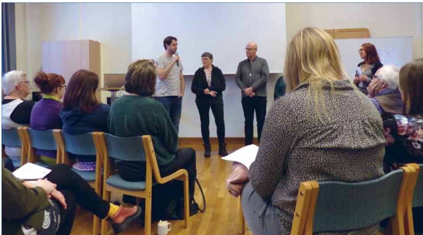
I samband med presentation av deltagarna fick de dela med sig av både glädjejämnerna och utmaningar i sitt arbete.

kyrkoandboken, då Grisbackakyrkan deltagit i en provperiod med nya kyrkoandboken. Någon av musikserierna är helt nyskriven medan andra har med sånger som man kan känna igen sedan tidigare. Det lät i alla fall som om deltagarna trivdes med att sjunga de nya musikserierna, som har influenser både från jazz, visa och gospel.