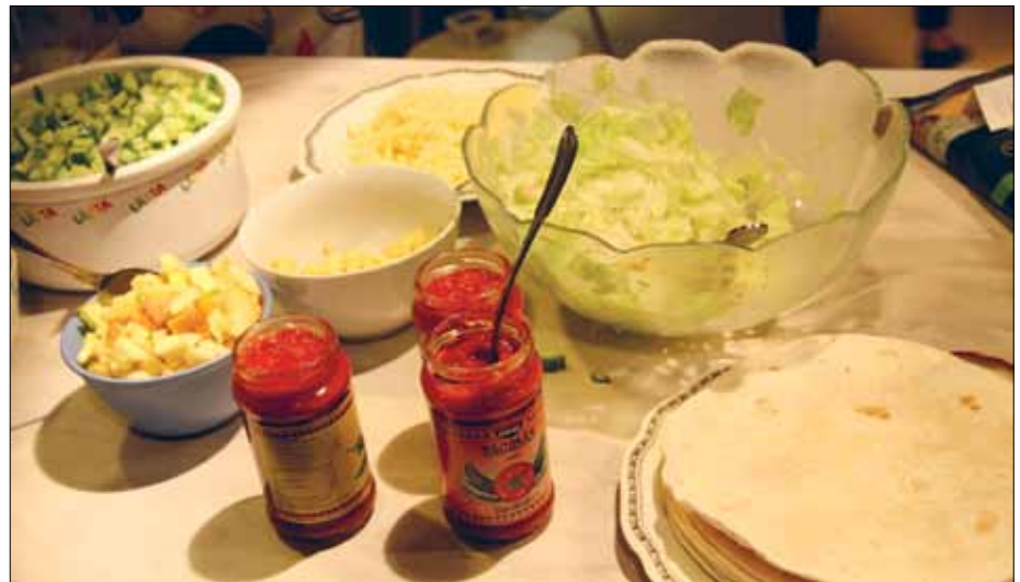
Tacomiddag går alltid hem bland ungdomar.