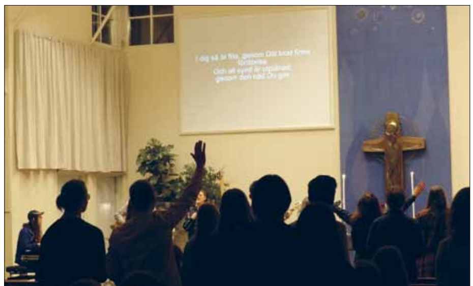
Lovsång hör till när unga kristna träffas. Här inleder den kvällsmötet på Livsväg Norr.