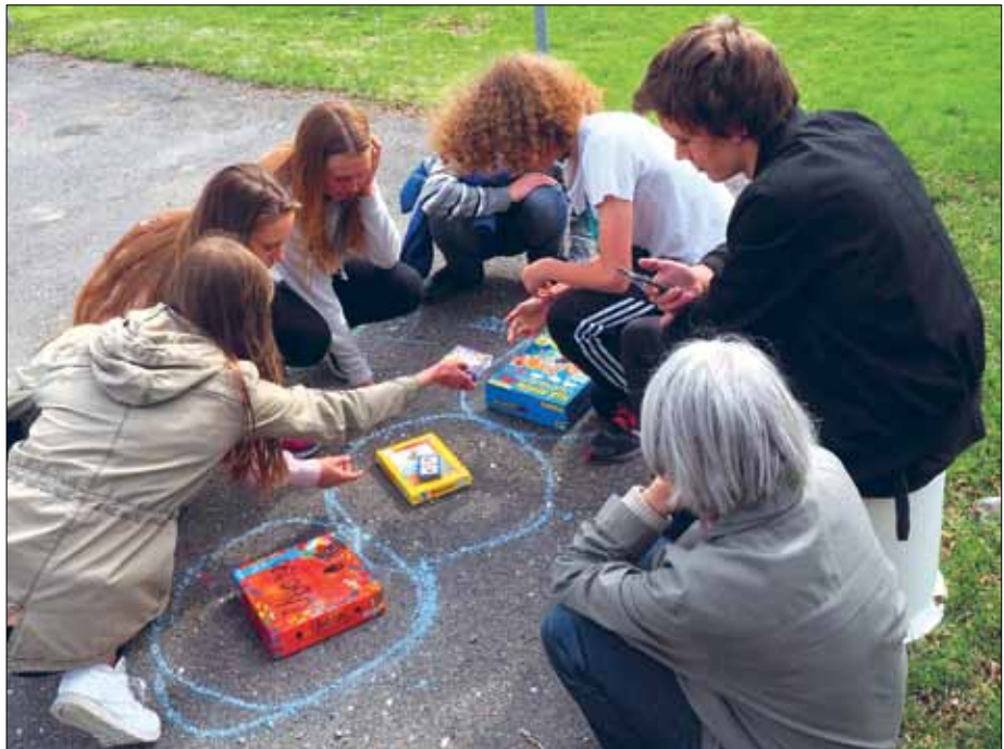
Det är lek, allvar och mycket gemenskap på ett konfirmandläger, något som ofta blir ett minne för livet.

En fråga som varit uppe till diskussion i flera år är hur man kan göra konfirmandläger som fungerar för de anställda. Att det inte blir för långa arbetsdagar som sliter hårt och genererar arbetstid som är svårt att kompensera med ledighet utan att det lokala arbetet blir lidande. Att få ihop en stabil lägerstab till tre långa läger varje sommar har inte varit någon lätt uppgift. Att många av de anställda har små tjänster gör det inte heller enklare.