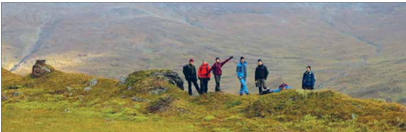
Många passade på att söka sig till fjällen för en fin höstupplevelse och god kristen gemenskap på Fjällväg höst i Klippen.