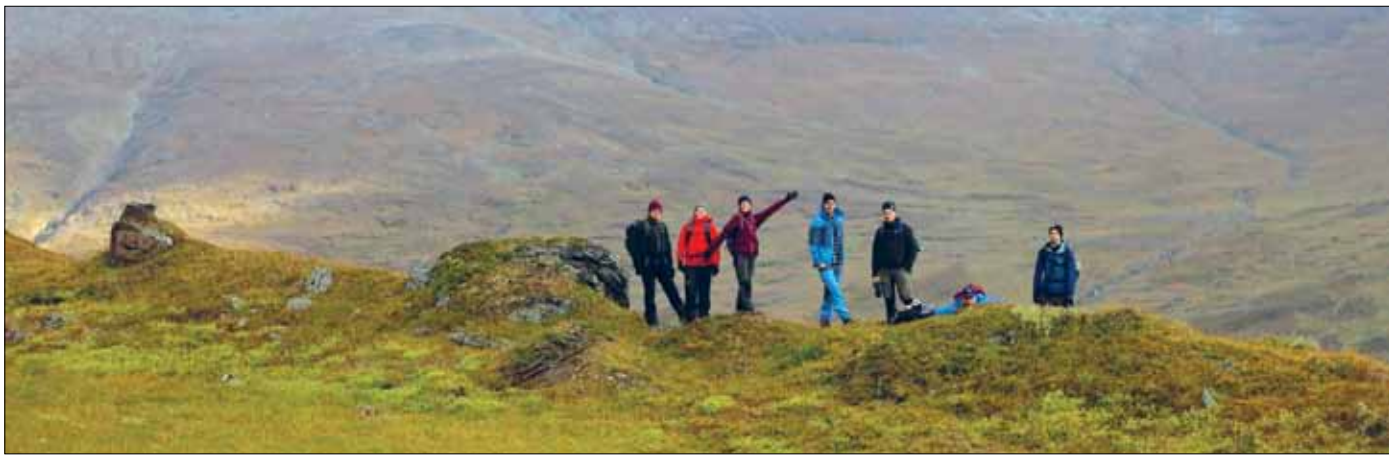
Många passade på att söka sig till fjällen för en fin höstupplevelse och god kristen gemenskap på Fjällväg höst i Klippen.