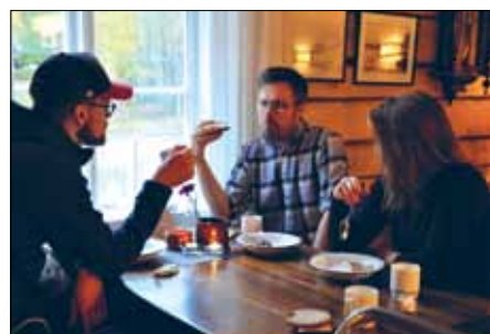
Samtalet kring matbordet är en viktig del av lägervistelsen.