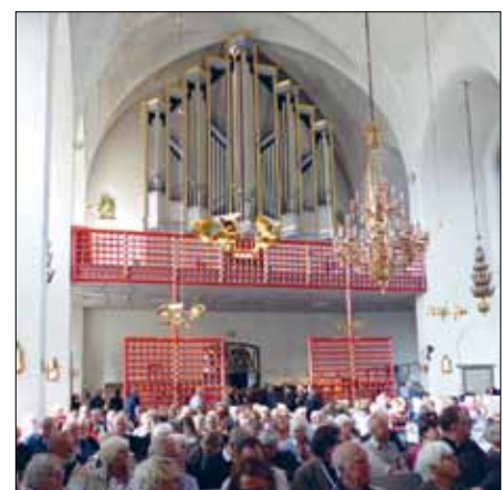
I en fullsatt domkyrka avslutades inspirationshelgen Fri till tro i Luleå.