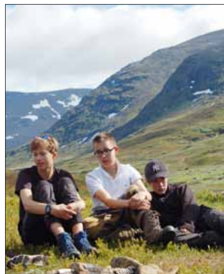
Några av sommarens konfirmander från Strömbäcksläget med start i Klippen.

Klippenkamraternas styrelse håller sitt årsmöte i oktober och uppgifter om den nya styrelsen kan finnas med först i nästa nummer. Hänvisning också till webben.