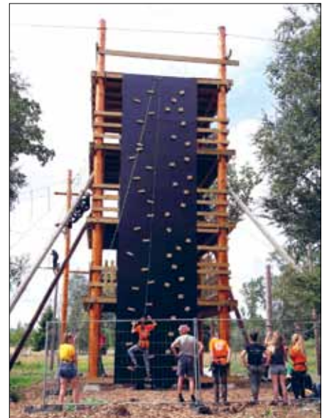
Höghöjdsbana där Jump-deltagarna fick testa sina gränser.

– Jag åkte dit med cirka sexton vänner och lämnade Jump med trettio nya vänner och ett minne för livet.