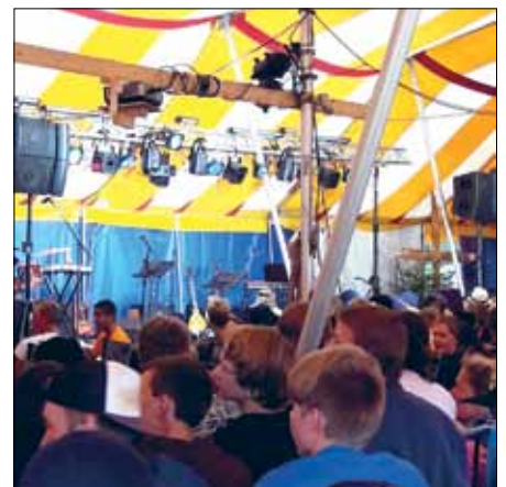
Det är inte bara slator och lera när scoutungdomarna träffas. Här på kvällsmöte i Jump-tältet.