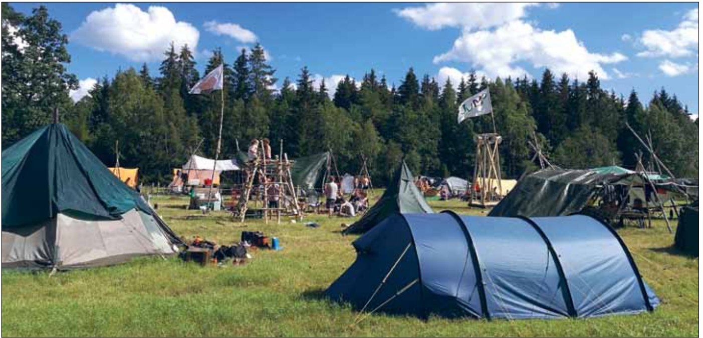
Scouter i tusental är ett minne för livet. I år var det Mossebo i Småland som var värd för EFS och Salts rikstäckande scoutläger Patrullriks.