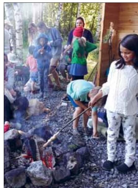
Vad är väl ett läger utan korv- eller pinnbrödsgrillning!?