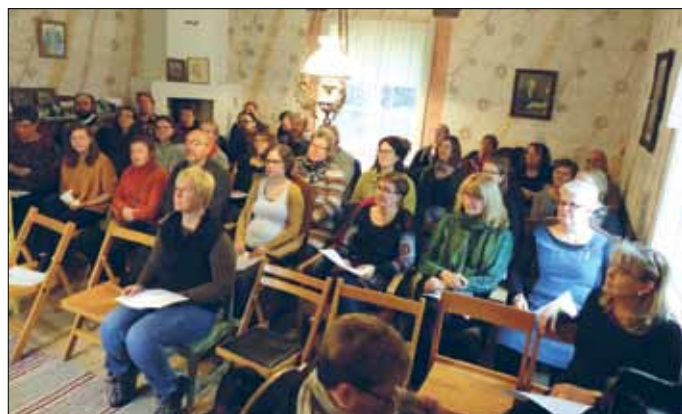
Personalkostnaderna blev lägre än budgeterat. Här är personalstyrkan samlad till fortbildningsdag i Roseniusgården.