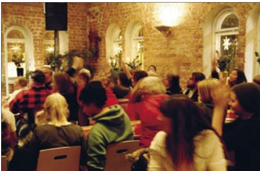
Mycket folk, mysig stämning och en fin mötesplats på Café Station, denna kväll med teckenspråkliga förtecken.

(Teckenspråksutbildning ges bland annat på Strömbäcks folkhögskola. För att lära sig teckenspråk kan man gå där två år och vill man bli tolk läser man ytterligare två år. Se www.strombacksfolkhogskola.se )