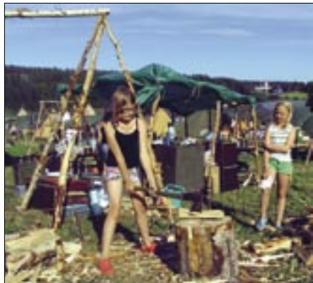
En nödvändig ingrediens i lägerlivet är ved. Just den här vedhuggningen skedde på Patrullriks i Mjösjöleden, Piteå, 2008.

Sommaren 2014 är det åter dags för Västerbotten att stå värd för Patrullriks. Förra gången, 1996, hölls scoutlägret i Holmsvattnet och nu blir det i Gärdsmark, Skellefteå. Förberedelsearbetet pågår sedan i somras och i höstas tillsattes en lägerkommitté.