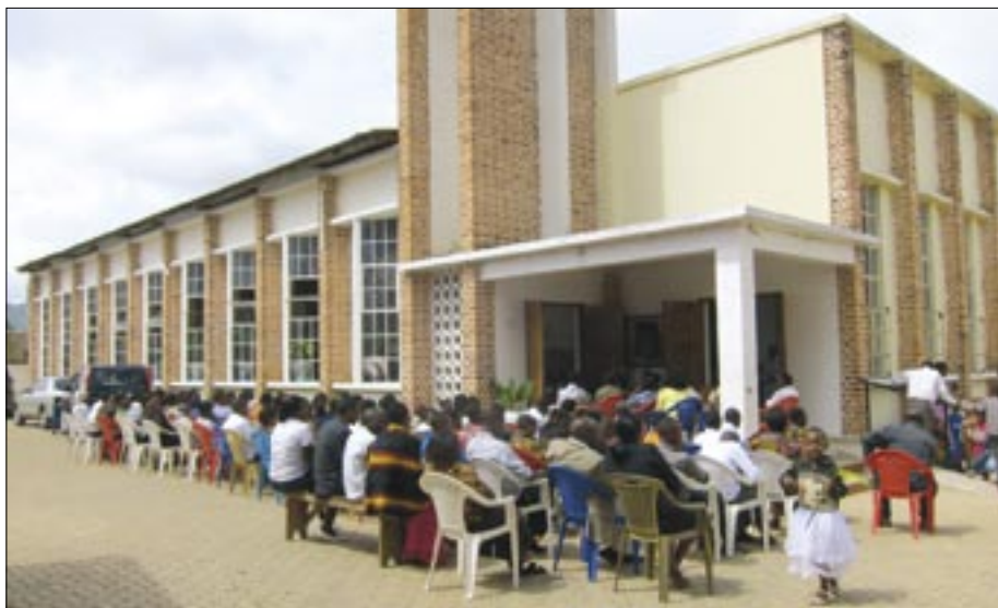
Trots att katedralen i Iringa är stor och man har tre gudstjänster varje söndag så ryms inte alla gudstjänstbesökare inne i kyrkan utan många får sitta utanför.

VI FICK TA DEL av mycket av församlingens och stiftets arbete: många gudstjänster, körer, söndagsskola, TEE-utbildningen, kvinnogrupp, barnhem, sjukhus, universitet och kyrkbyggen. Det var fantastiskt att se hur mycket de åstadkommer med små medel men stort engagemang. Vi som nu fick chansen att besöka vänförsamlingen och lära känna några av medlemmarna där insåg snabbt att det här med gästfrihet var ett område där vi svenskar har mycket att lära. Förutom fantastiskt mottagande vart vi än kom så stod vänförsamlingen för lunch och middag de första dagarna. När församlingen