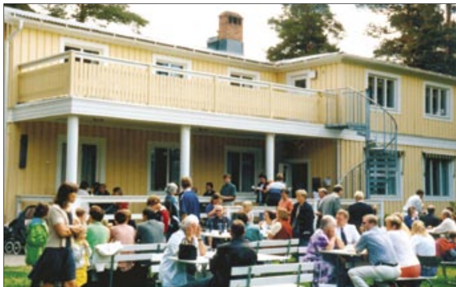
Sommarhemmet på Mobacken har erbjudit god samvaro under många år men just nu är framtiden något oviss.