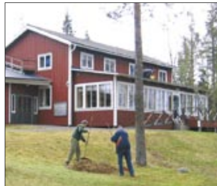
Det behövs många som hjälps åt för att hålla sommarhemmen igång. Här är det Strandudden som görs fint inför säsongen.

ULLBERGSTRÄSK ligger mellan Jörn och Arvidsjaur. Där finns ett väckelsemuseum i gamla bönhuset och skolan med viss sommarverksamhet i form av sång, film, föredrag och konsert (Anna-Lotta Larsson). För program se www.ullbergstrask.se